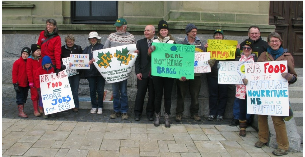
Some of the NFU-NB members and supporters who participated in the April 30 rally at the legislature.

In January 2015 when members of the NFU-NB board of directors met with the new Minister of Agriculture, Aquaculture and Fisheries,